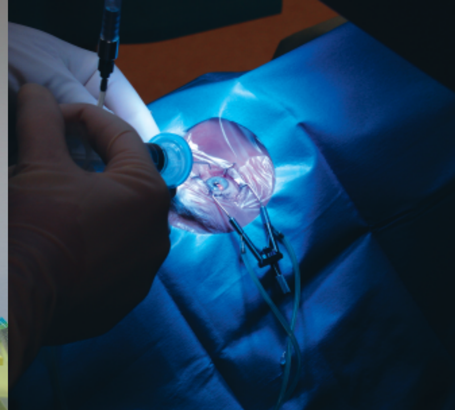
Een Lasek laseroperatie

Ik bekijk de groene letters op het raam. Hier kun je behandeld worden als je weer scherp wilt zien? Ik besluit het te vragen. Bij de entree zwaait de deur open en een dame achter een langwerpige tafel kijkt vriendelijk op. "Ja hoor, dat kan. Via een vooronderzoek wordt duidelijk welke soort behandeling voor uw oog geschikt is. Er zijn bovendien regelmatig informatieavonden waar u allerlei vragen kunt stellen."