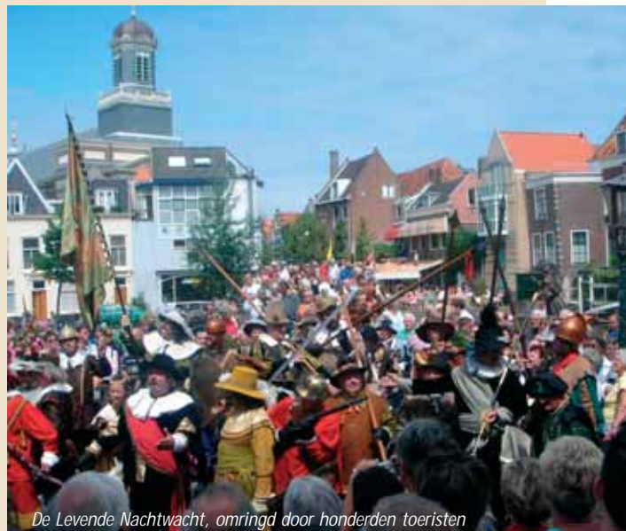
De Levende Nachtwacht, omringd door honderden toeristen

U kunt zich opgeven via www.rembrandtfestival.nl of door te bellen met Wim de Wolf tussen 9.00 en 17.00 uur op 071-5140435 of door een e-mail te sturen aan Rembrandt@centrumvanleiden.nl .