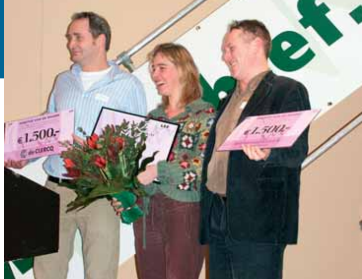
Ondernemers van Meelfabriek Zijlstream winnen 2e voorronde van LEF

LEF wil starters stimuleren en een platform bieden om hun bedrijf te presenteren. Hoewel het een wedstrijd is, kent LEF geen verliezers. Iedere deelnemer krijgt advies over zijn be-