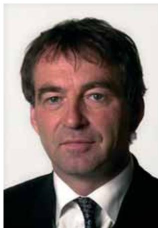
Staatssecretaris Van Geel

35 à 40 hectare grond aan de rand van de stad die ingericht kan worden als bedrijvengebied. De gemeente en de Provincie hadden hun goedkeuring verleend. Het omringende natuurgebied bleef gespaard en Leiden zou er een bedrijventerrein van formaat bij krijgen. Totdat de fijnstofproblematiek roet in het eten gooide. De aanwezigheid van fijn stof is volgens Europese richtlijnen een belangrijk criterium voor de meting van de luchtkwaliteit.