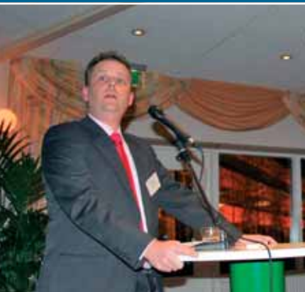
Verkiezingsdebat: grote opkomst, veel vragen