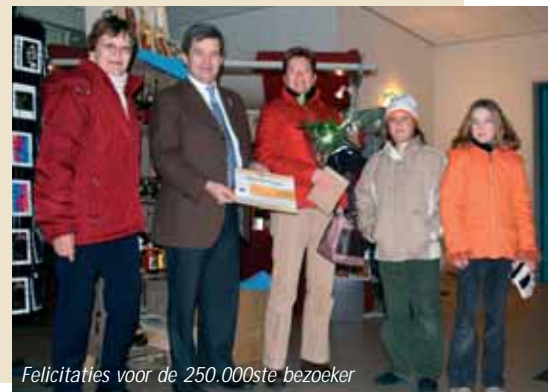
Felicities voor de 250.000ste bezoeker

Dit unieke kunstevenement is vastgelegd op een prachtige DVD. De voorbereiding, het maken van de sculpturen en de expositie zijn in beeld gebracht. Een waardevolle herinnering aan deze sneeuw- en ijscreaties, gemaakt door HAASVIDEO, is te bestellen via www.haasvideo.nl .