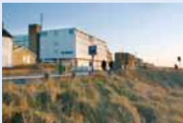
De Baak: Congres aan zee, een formule die wérkt!