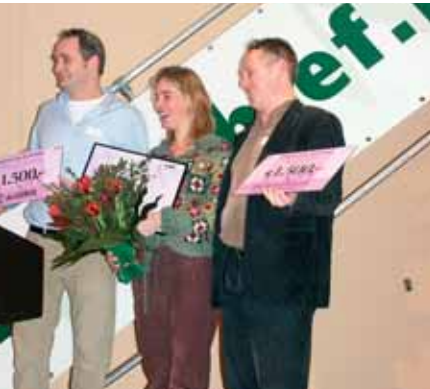
LEF bestaat 10 jaar: grande finale op komst

MAGAZINE VOOR ONDERNEMERS IN LEIDEN EN OMGEVING