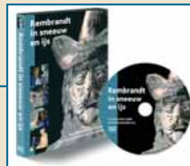
dvd album: 'Rembrandt in sneeuw en ijs'