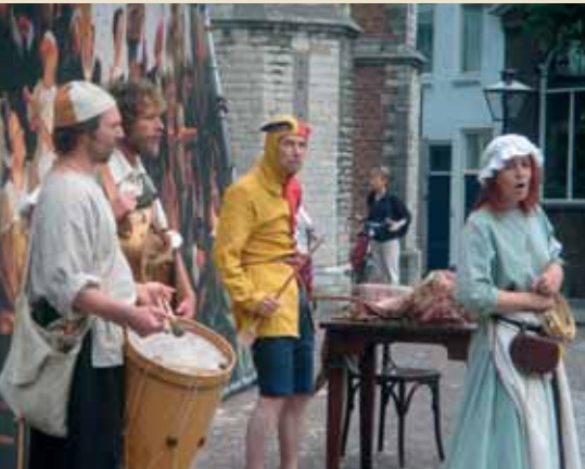
Klucht bij de Hooglandse kerk

Hooglandse kerk en natuurlijk bij de Rembrandtplaats. Het zal krioelen van de figuranten die het dagelijkse leven uit die tijd uitbeelden. Acteurs zullen beroemde kluchten spelen zoals die ook toen werden opgevoerd. Er wordt gezongen en gedanst. Geschat wordt dat zestigduizend bezoekers en toeristen de verjaardag van Rembrandt komen vieren.