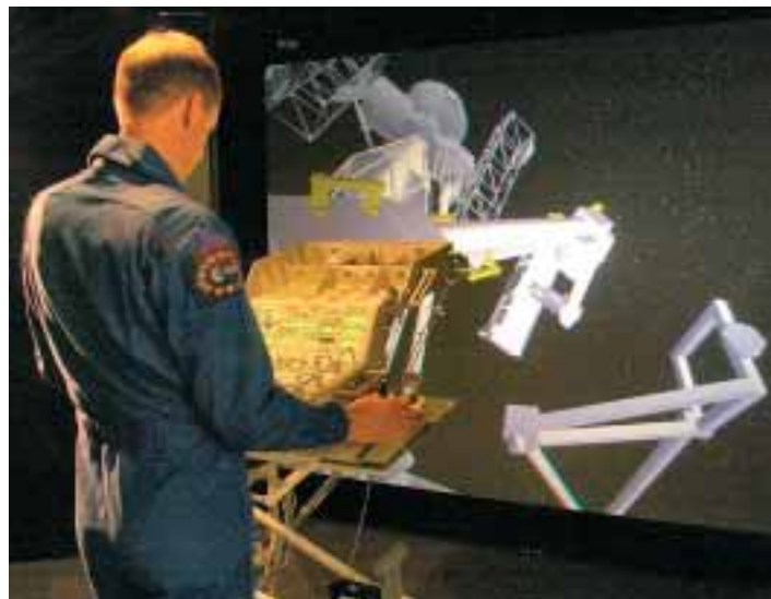
Frank de Winne, de Belgische astronaut, bedient met een speciaal gebouwde simulator de robotarm.

Tussen alle biotechnologie en biomedische bedrijven is Dutch Space, een bedrijf in ruimtevaarttechniek, een aparte loot aan de kennisboom op het Bio Science Park. Dutch Space, de grootste ruimtevaartonderneming in Nederland, is vanaf 1993 gevestigd in Leiden. De overeind gebleven ruimtevaartafdeling van Fokker ging in 2002 verder onder de naam Dutch Space. Zij heeft bijgedragen aan de ontwikkeling