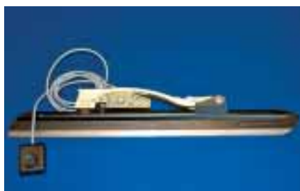
Klupschaats met programmeerbare chip

Een ingebouwde en programmeerbare chip in de schaats kan het uitklapmechanisme tijdens de start tijdelijk blokkeren. Hierdoor heeft de schaatser een betere starthouding zodat deze volledig kan profiteren van de snelheid van de klapschaats.