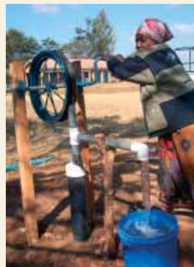
Een vrouw pompt water met touwpomp