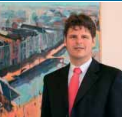
Ondernemersfonds stimuleert vereniging van bedrijven