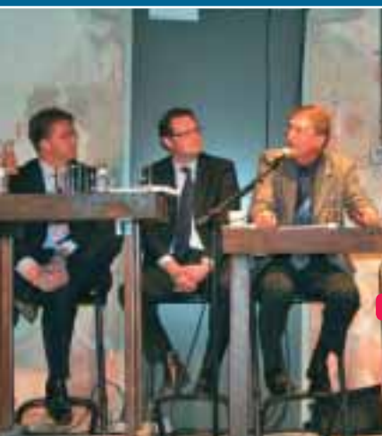
Leiden ontdekt zichzelf in debat over citymarketing