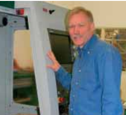
Leiden, Stad van Ontdekkers en Uitvinders

MAGAZINE VOOR ONDERNEMERS IN LEIDEN EN OMGEVING